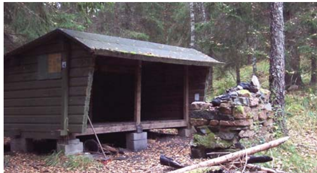
Vindskyddet vid Vargberget

Vid etappens början ligger ett vindskydd i en liten glänta i skogen. Framför vindskyddet finns en eldstad. Det kan vara svårt att tälta här eftersom marken lutar och är lite stenig, men någon hyfsad plats går att hitta.