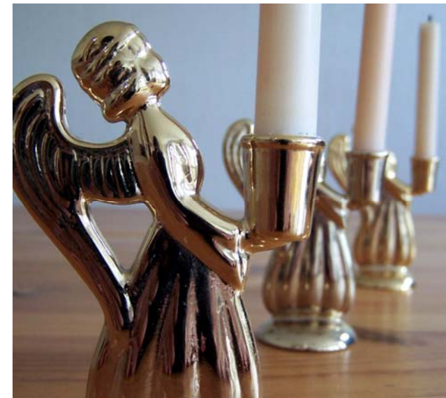
Ljusstakar från Skultuna

Trehundra meter nordväst om Skultuna Bruk, i den västra delen av Kvarnbackaparken finns två runstenar från 1100-talet. En av dem har inskriptionen "Gunmald lät resa denna sten efter Garfast sin son, en god ung man och han hade farit till England. Gud hjälpe hans själ".