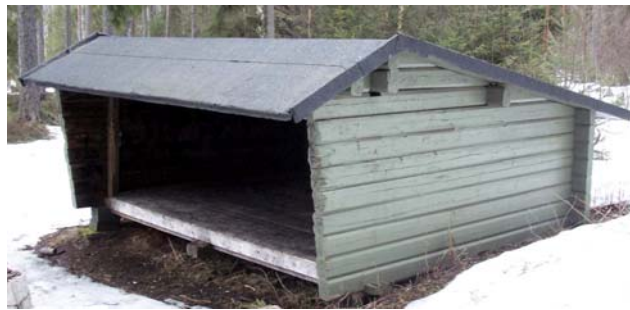
Vindskyddet vid Toftsjön

Vid Toftsjön ligger ett vindskydd i fint läge med öppningen mot vattnet. Det har plats för 6-8 personer. Tältplatser går att hitta runt vindskyddet.