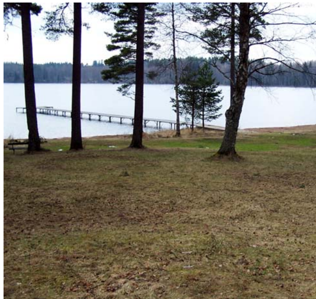
Badplatsen vid Lillsjön

Vid Lillsjön där etappen startar ligger en badplats med stora gräsytor och gott om parkeringsplatser. Här finns bryggor, omklädningshytter, toaletter, bord och bänkar mm.