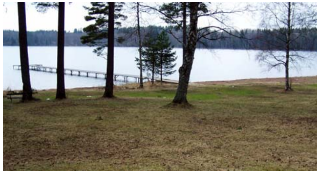
Badplatsen vid Lillsjön

Vid etappmålet Lillsjön ligger en badplats med stora gräsytor och gott om parkeringsplatser. Här finns bryggor, omklädningshytter, toaletter, bord och bänkar mm.