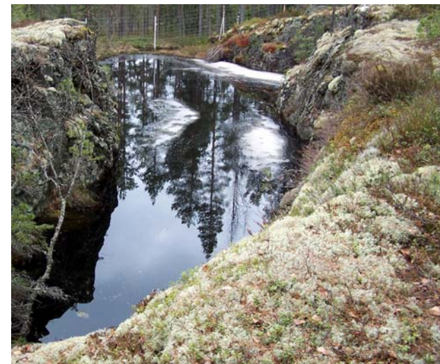
Kvartsbrottet på Gåsmyrberget

Sprickbildningar på bergets nordvästra sida har skapat en ca fyra meter djup grotta, Vasagrottan, där Gustav Vasa enligt traditionen ska ha sökt skydd vid sin flykt undan danskarna år 1520. Grottan är ganska svår att hitta.