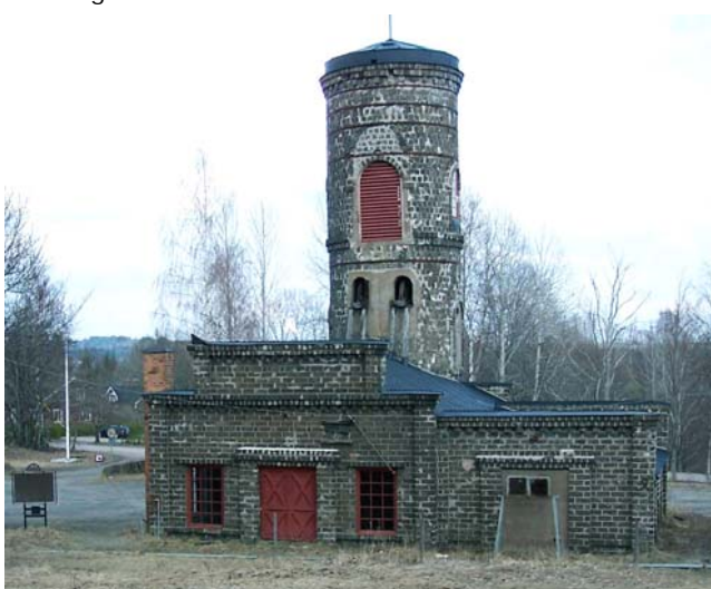
Gröndalslaven vid Klackberg

Redan 1466 fanns en hytta i Fliken. Vid mitten av 1600-talet var hyttan en av socknens största. Anläggningen lades ner år 1888. Idag återstår rester av masugnen, kanalkonstruktioner och slagghögar. Vid Fliken finns också en herrgård från 1850-talet.