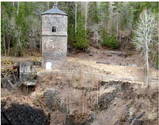
Storgruvans lave vid Klackberg

Efter Silvtjärn följer en lättgången stig fram till Kolningberg. Här ser du på vänster sida om vägen ett gammalt gruvhål. På den återstående vandringen fram till Klackberg letar sig stigen fram genom ett område som formats av hundratals år av grubbrytning. Du passerar ett stort antal gruvhål, vissa med hissande djup och andra lite mindre.