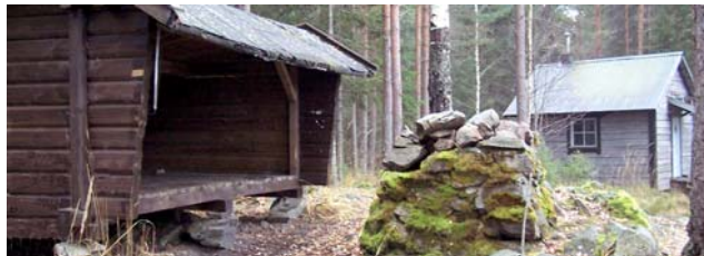
Vindskyddet och raststuga vid lilla Älgsjön

Nedanför Klackbergsgården vid Noren finns en badplats.