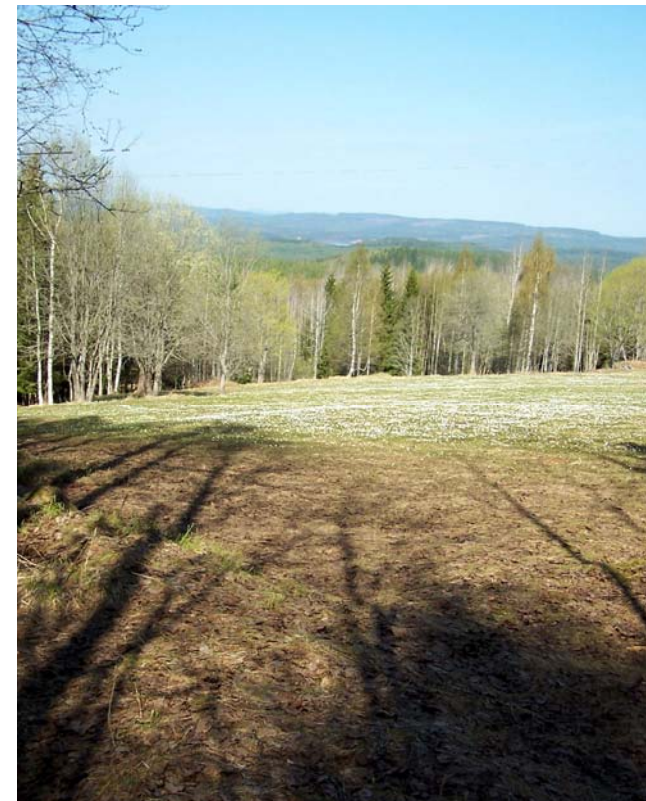
Utsikt i närheten av Malingsklack

För den som söker friluftsliv och naturupplevelser passar området runt Malingsbo bra. Här finns möjlighet till jakt, fiske, camping och vandringar i de djupa skogarna.