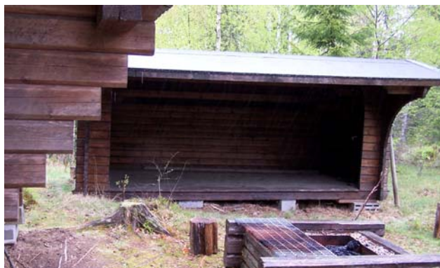
Rastplatsen innan Matkullen

Nästa lägerplats ligger efter ytterligare några hundra meter. Här finns även TC. Detta vindskydd ligger också vackert med öppningen mot sjön.