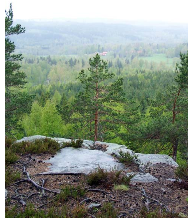
Utsikt från Matkullen

Berget är bevuxet med äldre barrblandskog. Här har man bland annat påträffat den sällsynta stiftgelélaven.