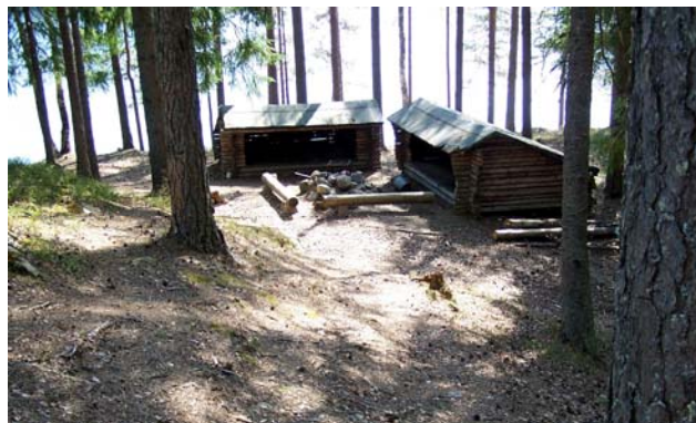
Två av vindskydden vid Örtjärnen

Nästa lägerplats ligger efter ytterligare några hundra meter. Här finns även TC. Detta vindskydd ligger också vackert med öppningen mot sjön.