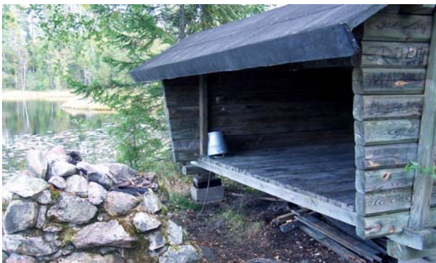
Vindskyddet vid sjön Kolpen