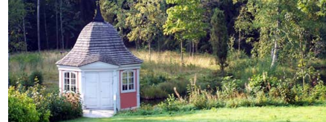
Ebba Brahes lusthus

Idag återstår endast en timrad mangårdsbyggnad från 1817 och, den mest kända byggnaden i Bockhammar, Ebba Brahes lusthus. Lusthuset ligger vackert beläget nere vid älven. På taket sitter en vindflöjel där man kan läsa texten "Ebba Brahes paviljong".