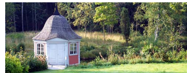
Ebba Brahes lusthus

Änkedrottning Kristina motarbetade kärleksförbindelsen av politiska skäl. Hon ville se kungen gift med en tysk prinsessa. Hennes envisa motstånd förmådde Gustav Adolf att avstå från kärleken. År 1615 drog han ut i fält och det blev slutet på den romantiska förbindelsen. Tre år senare gifte sig Ebba Brahe med greven och fältherren Jakob De la Gardie. De fick ett långt äktenskap och Ebba hann bli mor till inte mindre än 14 barn. En av dem var Magnus Gabriel De la Gardie. Kung Gustav Adolf gifte sig med Maria Eleonora av Brandenburg. Vid kungens död år 1632 var deras enda barn dottern Kristina 5 år.