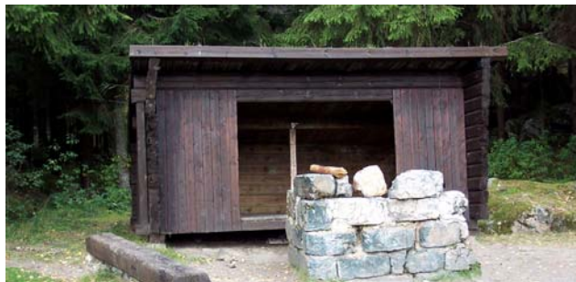
Vindskyddet vid Trummelsberg

Vid ettappmålet Bockhammar ligger ett vindskydd på en kulle inne i lövskogen en liten bit från vägen. TC finns i anslutning till vindskyddet. Terrängen lämpar sig dåligt för att tälta.