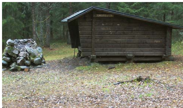
Vindskyddet vid norra Morsjön

Vid etappens startpunkt vid norra Morsjön finns ett vindskydd med eldstad och TC. Vindskyddet ligger längs en liten skogsväg ovanför sjön. Här finns även plats att slå upp några tält. Vid sjön, en bit från vindskyddet, finns en badplats.