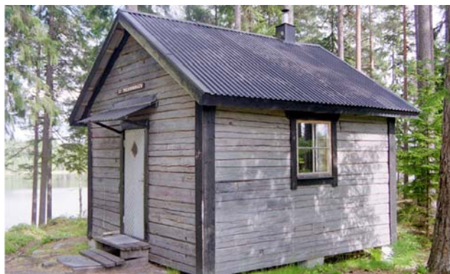
Raststugan vid stora Trehörningen

Vid ettappmålet norra Morsjön ligger ett vindskydd i en skogsbacke som sluttar ner mot sjön. Här finns eldstad och TC. Det går bra att sätta upp några tält. Vid sjön, en bit från vindskyddet, finns en badplats.