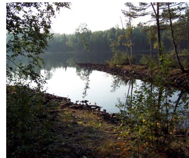
Sjön Stora Kedjen vid Trummelsberg